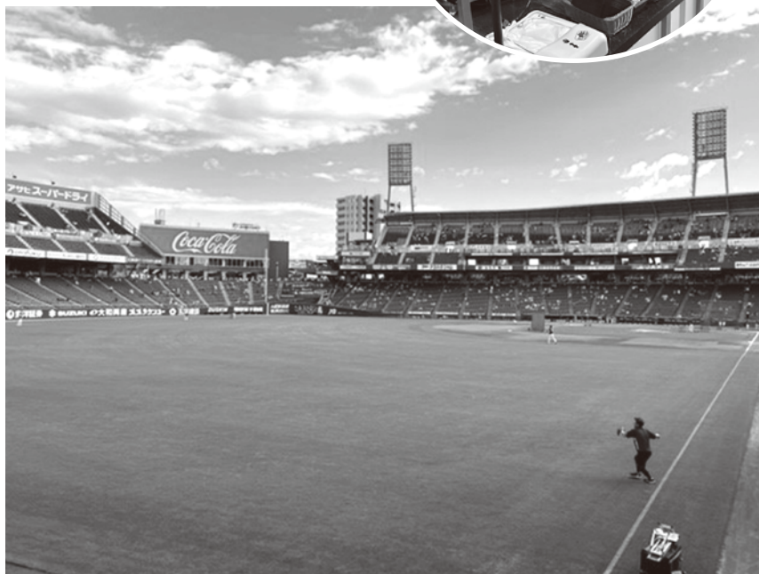
パーティベランダからの風景