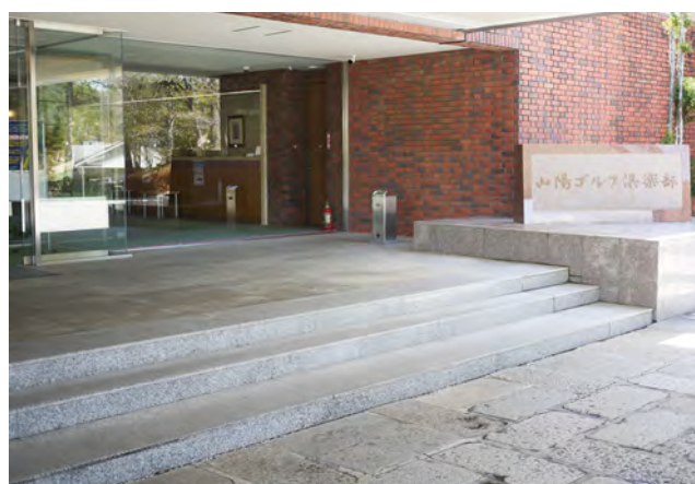
山陽ゴルフ倶楽部